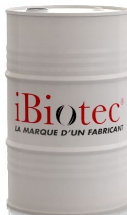
Fût 200 L