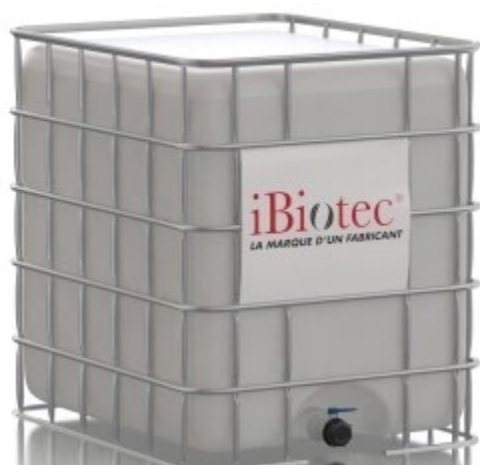
Container 1000 L